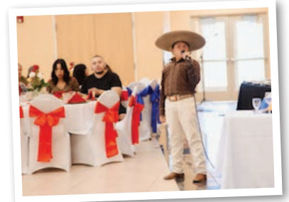
Todas las fotografías de la ceremonia de juramento del obispo Pulido en la iglesia St. Joseph en Kennewick y la recepción en Dillon Hall son cortesía de Moctezuma Media.