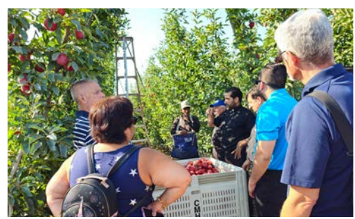
Un recorrido incluyó un huerto del Valle Inferior.

Nota del editor: Otra versión de esta historia apareció en Our Sunday Visitor a principios de septiembre. Pueden encontrarla en este enlace: https://bit.ly/3PEbmsy .