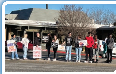
El grupo de estudiantes de Tri-Cities de Por Vida junto en compañía de otros miembros de la calle cerca de John Dam Plaza en Richland el 16 de enero.