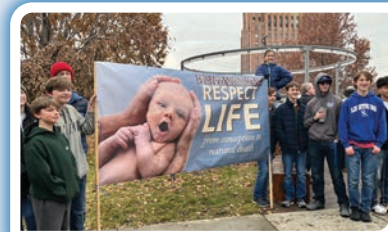
Los miembros de St. Paul Cathedral Life Teen y Yakima Students for Life estuvieron entre los cientos que se unieron a la Caminata por la Vida el 21 de enero en Yakima.