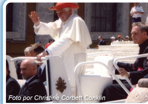
El papamóvil y su ocupante hicieron una vista impresionante.

asistentes para que sostuviéramos cualquier objeto que deseáramos que el Papa bendijera. A la fecha, atesoro una botella de agua bendita, y una cruz de madera de San Damiano que compré para ser bendecida.