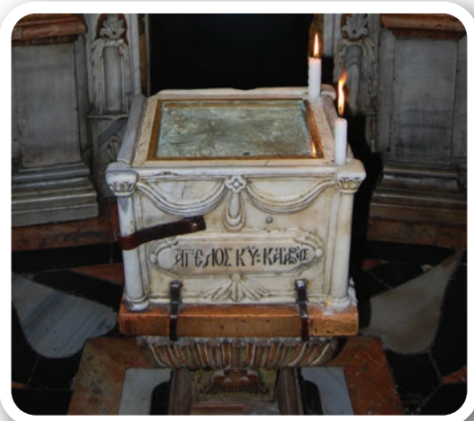
Una parte de la piedra real que se dice que se retiró de la entrada a la tumba de Jesús está encerrada para ser vista.

“A veces se dice que la Tierra Santa es como el quinto Evangelio – que da