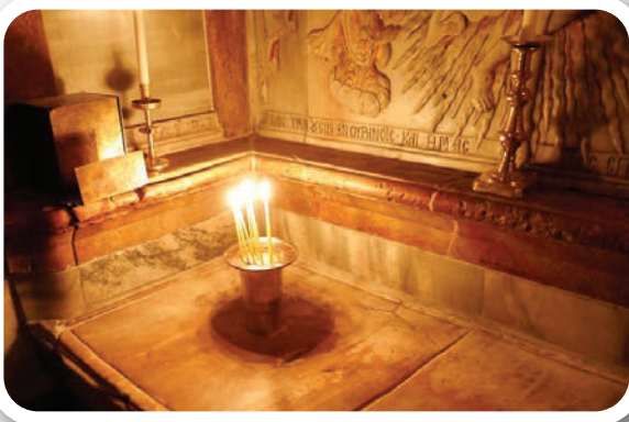
El banco restaurado en la Iglesia del Santo Sepulcro en el que se cree que fue colocado el cuerpo de Jesús y desde el cual resucitó de entre los muertos.

Por lo tanto, este año, mientras nos preparamos para el “Triduo Santo” (la conmemoración de la Última Cena el Jueves Santo, la sombría observación de la muerte de Cristo el Viernes Santo, la Vigilia que Sus seguidores celebraron el Sábado de Gloria,) aferrémonos a nuestra fe católica que nos permite seguir viviendo el milagro de nuestra Salvación. Entonces, celebremos la Pascua con renovada alegría, conscientes de la presencia real y viva de Jesús en medio de nosotros hoy.