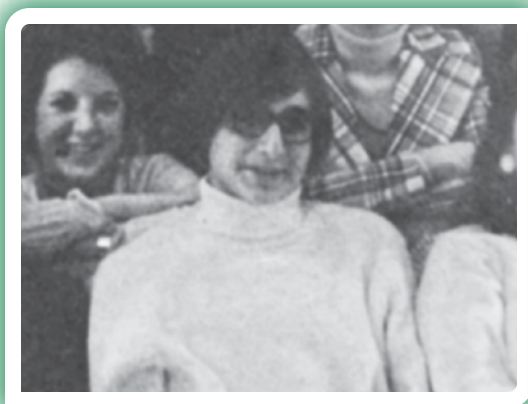
El obispo Joseph Tyson ayudó a lanzar una orgullosa tradición de Estudiantes de por vida.