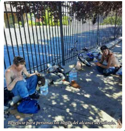
Beneficio para personas sin hogar del alcance del sábado.

Kusske expresó su agradecimiento a “nuestra generosa comunidad y los que han donado a Saint Vincent's Charity, incluyendo a Caridades Católicas por cubrir el costo de los burritos de los sábados para Camp Hope.”