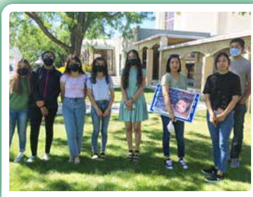
Estudiantes en Wenatchee, donde se inició el Capítulo del Divino Niño, escucharon una presentación provída a principios de este mes.