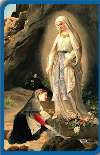
Nuestra Señora de Lourdes

Nuestra Señora apareció muchas veces a Bernadette Soubirous de 14 años en Lourdes, Francia, se reporta que ella dijo: “No te prometo hacerte feliz en este mundo sino en el otro (refiriéndose al Cielo),” de acuerdo con el sitio del Santuario de Lourdes. Nuestra Señora nos pide: “penitencia, penitencia, penitencia. Orar por los pecadores.”