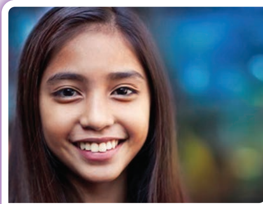
Enfócate en lo bueno.

• Ser intencional sobre el consumo de medios: ¿Es posible que un determinado canal de noticias o redes sociales esté contribuyendo a la infelicidad? Debemos evaluar qué medios solemos consumir cada día, desde podcasts hasta artículos de noticias, y decidir qué es lo que le sirve a