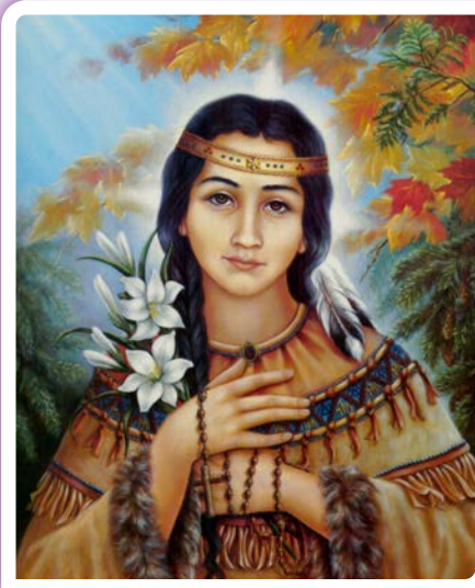
Sabes quien es?

14 de Julio. Nuestra primera santa Nativa-americana, esta joven se convirtió