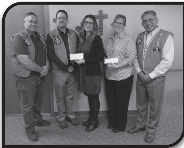
Los Caballeros de Colón Concilio #10653 presentó un total de $3,000 a Caridades Católicas Sirviendo a Washington Central.