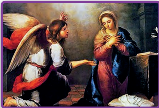
La aparición del ángel Gabriel a María es el foco del primer misterio alegre, la Anunciación.

Una simple cadena de cuentas con un pequeño crucifijo ha servido como una poderosa ayuda de oración en la Iglesia Católica por muchos siglos.