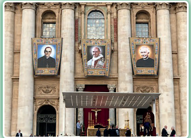
En el Vaticano se exhibieron banderas con imágenes de los nuevos santos.