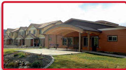
Río de Vida vivienda del trabajador.

Río de Vida es un desarrollo de 51 unidades que alberga a los trabajadores agrícolas y al personal de la fuerza laboral. El sitio proveerá vivienda segura y accesible para cerca de 200 personas que están necesitadas. St. Anthony Terrace es un desarrollo de 61 unidades para vivienda de personas mayores de 55 años, proporcionando vivienda accesible para aproximadamente 125 personas.