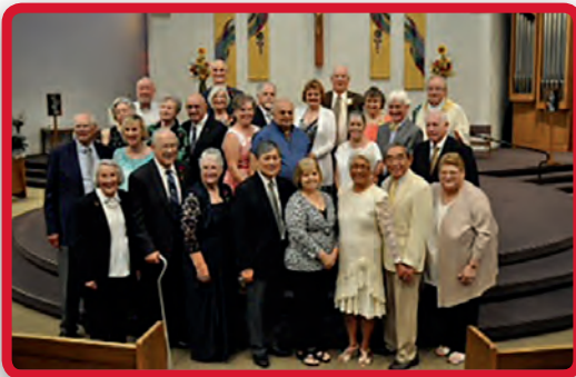
Parejas celebrando sus 50 aniversarios de bodas se reunieron en la Iglesia de Cristo Rey en Richland.

“Lo que Dios ha unido, no lo separe el hombre.” (Mateo:19,6)