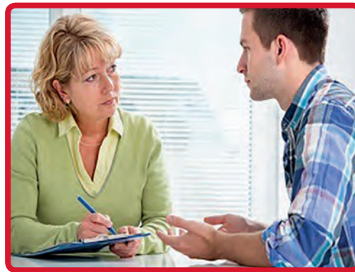
No permita que la "cortesía" interfiera con hablar si cree que un niño está en peligro.

Recientemente, yo tuve el honor de conocer a una mujer que está en una misión para hacer conciencia sobre el