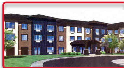
Representación del artista de St. Anthony Terrace.