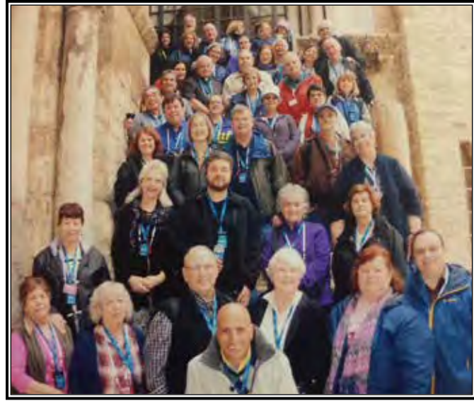
El grupo de peregrinos en la Iglesia Holy Sepulchre.