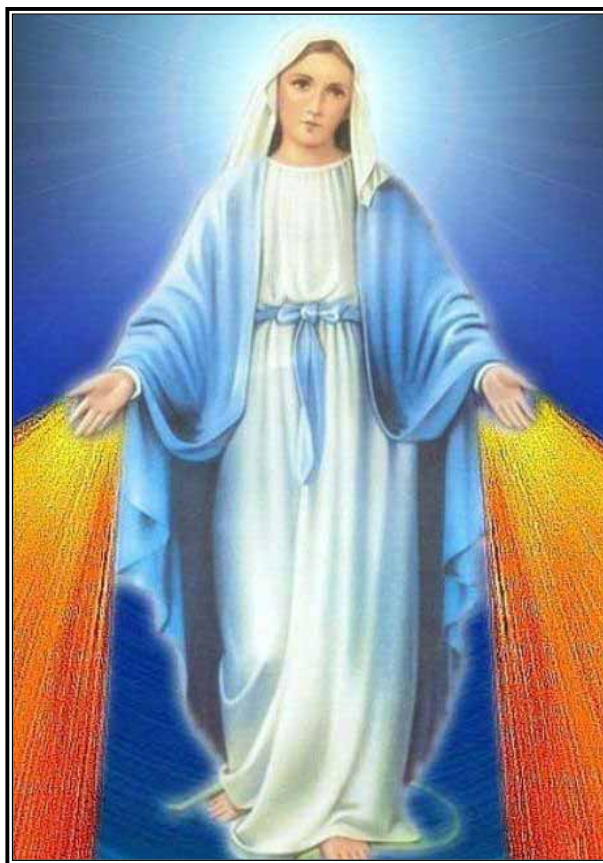
La Virgen María: un modelo de amor.

"Estamos trabajando para mejorar a la mujer Católica y para mejorar la sociedad en general," dijo Bommersbach, refiriéndose al grupo YLI de Yakima. Las integrantes del grupo oramos juntas, incluyendo intenciones personales; recaudamos fondos para la educación de los seminaristas y becas para las escuelas Católicas; y ayudamos con los proyectos de