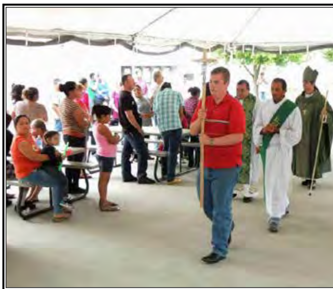
Una procesión comenzó una misa vespertina en Monitor.

este dedicado equipo de seminaristas ofrece a los trabajadores del campo durante su descanso