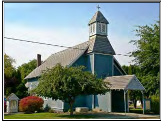
Iglesia Católica Holy Trinity: es un sitio de la fe.

El entonces Obispo Carlos A. Sevilla, S.J., respondió a comienzos del 2009 despidiendo ocho