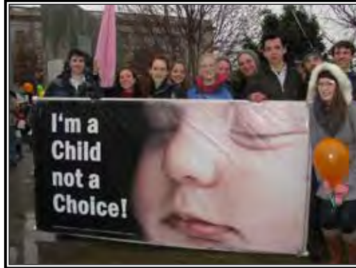
Los estudiantes de Tri-Cities Prep se unieron a la caminata.