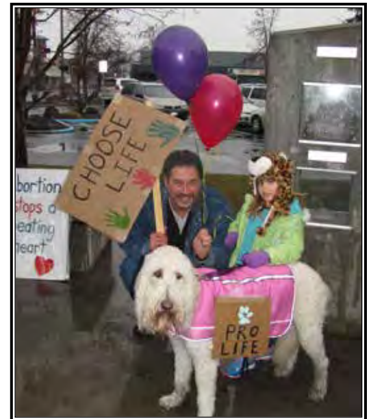
Incluso las mascotas tomaron parte en el evento del 2015, Caminando Por El Derecho a La Vida.

En reuniones en la iglesia y, antes de soltar los globos empapados por la lluvia en la Plaza