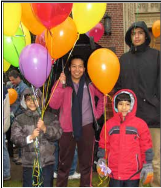
Fue un día para que las familias participaran para defender el derecho a la vida.

Armados con paraguas e impermeables, cientos de fieles defensores de la vida de toda el área de Washington Central desafiaron la lluvia y temperaturas casi congelantes el 17 de enero para tomar parte en la Caminata Anual pro Vida en Yakima. El evento marca el aniversario de Roe