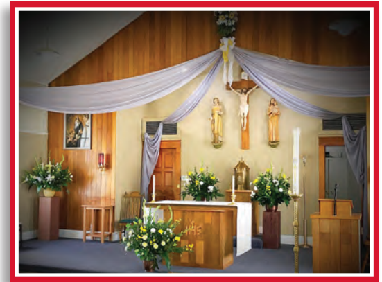
Our Lady of the Assumption, Cashmere

Ninguna de las dos parroquias Our Lady of the Snows o St. Francis cuentan