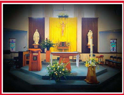
Our Lady of the Assumption, Leavenworth

Las parroquias Our Lady of the Snows en Leavenworth y la Parroquia Saint Francis Xavier en Cashmere se unieron en una nueva parroquia el 1 de abril, con la aprobación del Obispo Joseph Tyson. Las dos pequeñas congregaciones se han convertido ahora en la Parroquia Our Lady of the Assumption.