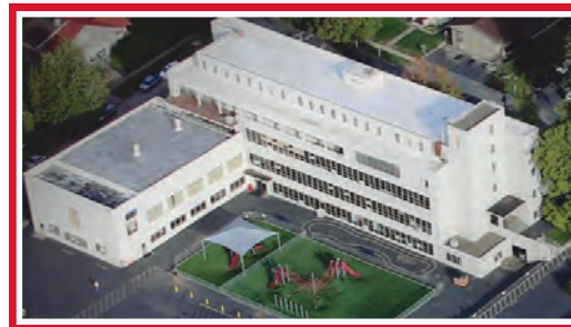
La Escuela de la Catedral St. Paul

El edificio actual de la escuela, cariñosamente conocido como la “nueva escuela” por muchos ex alumnos y padres, fue construido en 1950 en el 1214 al oeste de la Avenida Chestnut. Reemplazando a la “vieja escuela” que estaba en el sitio del actual salón de recepción de St. Paul. El edificio actual de la escuela continuará siendo usado para los programas de educación religiosa de la catedral y algunos otros eventos diocesanos. Parte del edificio podrá ser arrendado a un