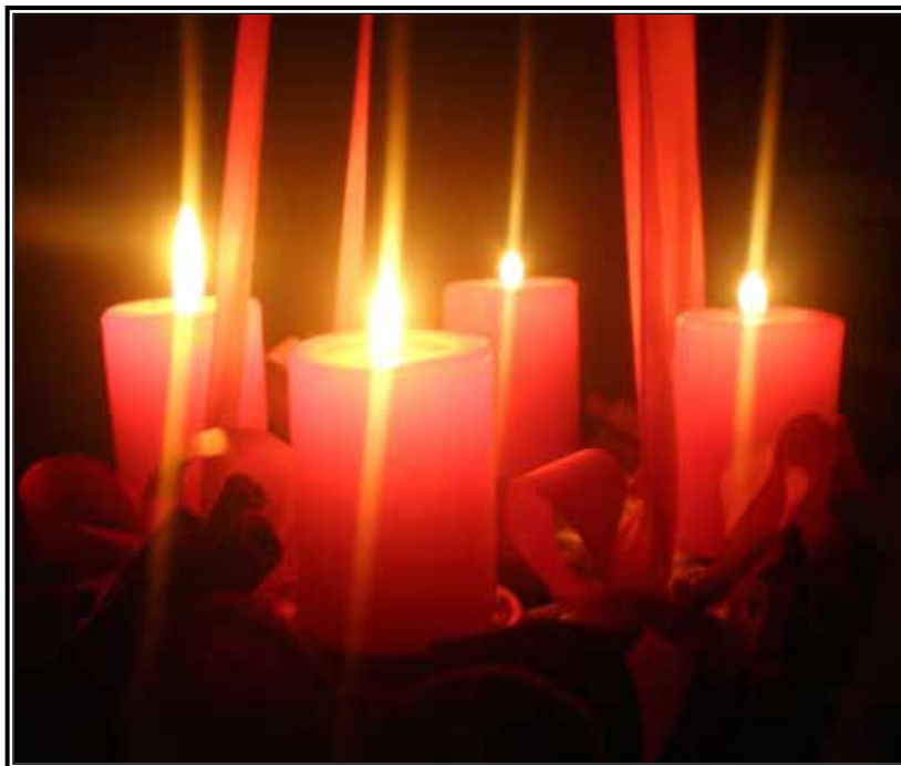
Una corona de Adviento nos ayuda a enfocarnos a la llegada de la Navidad.

Consideren la posibilidad de retrasar el encender su árbol de Navidad hasta la víspera de Navidad, o por lo menos hasta el 17 de diciembre, cuando las antífonas “O”