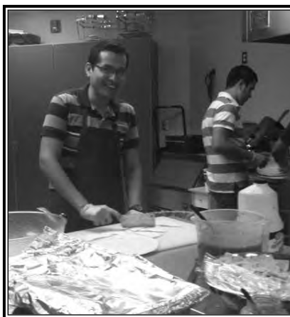
Los ingresos de los desayunos de YLI en la iglesia de Holy Family en Yakima nos ayudó a llegar a nuestra meta para el Fondo de los Seminaristas.