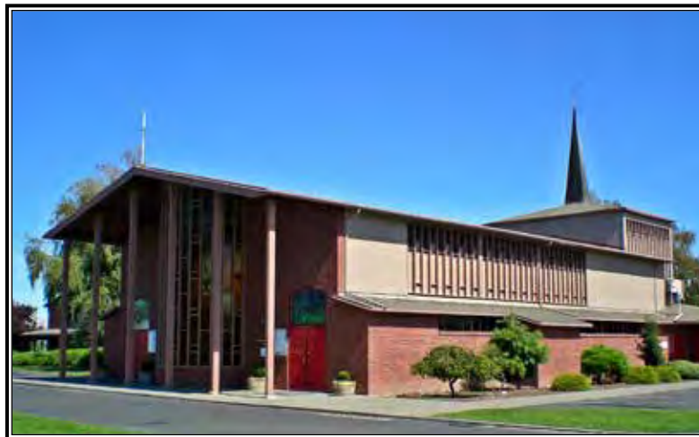
Iglesia Blessed Sacrament: “Las generaciones crecen en la fe.”

La orgullosa historia de la Iglesia Blessed Sacrament de Grandview, establecida en medio de tierras ricas de cultivo con huertas de manzanas, lúpulo y uvas, comenzó muy humilde. ¡En realidad, tan humilde que cuando los materiales iniciales de construcción para una iglesia fueron ordenados cerca de 1916, fueron mantenidos en un vagón hasta que se