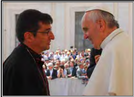
El Obispo Tyson acompañado del Papa Francisco en Roma.

Ahora, después de muchas miles de millas, y de manejar a cientos de celebraciones especiales en todas las