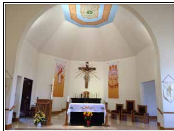
Un fresco de los Nativos Americanos se encuentra exhibido en la parte superior del altar.

“Muchos niños del programa RICA, preguntan: ‘Padre, ¿quién es ese santo?’” mientras apuntan a una estatua en particular, observaba el Padre Godina. O, alguien recién llegado a la parroquia pregunta sobre alguna estatua. Es la oportunidad para “momentos de enseñanza,” dice el padre para explicar sobre las bellas tradiciones de nuestra fe católica.