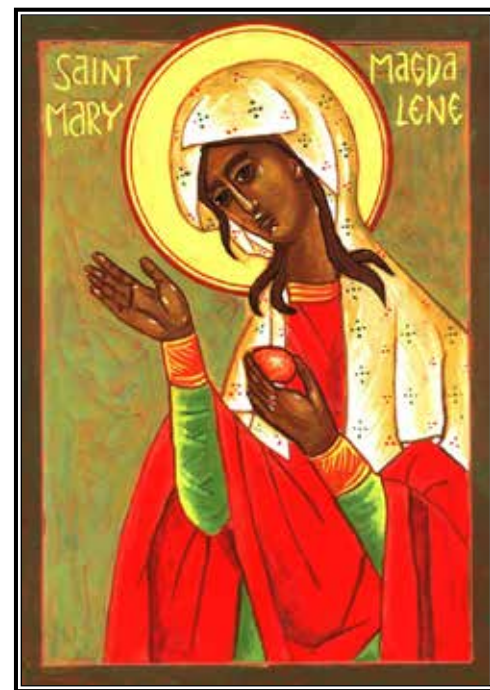
En esta arte católica oriental, Santa María Magdalena, se muestra siendo testigo de la Resurrección sosteniendo un huevo rojo. La tradición dice que usó el huevo como símbolo para explicar la resurrección de Cristo a Tiberio César. El se burlo de la idea, diciendo que no era más probable que el huevo se ponga rojo-En ese momento, el huevo cambio de color. -Icon escrito por Robert Béla Wilhelm, Th.D. www.sacredstorytelling.org

El siempre presente huevo, por ejemplo – ya sea de dulce envuelto en aluminio o un huevo de verdad en una búsqueda de huevos de Pascua – es