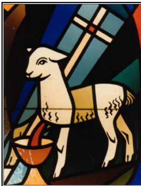
Este Vitral en una capilla Antigua del convento en Cajon, California retrata el “Cordero de Dios o “Agnus Dei.”

En medio de toda esta histeria de fiesta, es buena idea ir con calma y recordar la verdadera “razón de la temporada.” La Pascua no es un día más