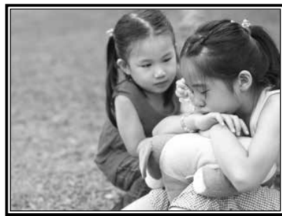
El programa de Ambiente Seguro está diseñado para proteger a nuestros niños.

Para concluir, recuerden que el fomento de la amabilidad no tiene que ser una producción en grande. Las mejores ideas suelen estar entre las más sencillas. Al trabajar juntos, los padres de familia, los maestros y los adolescentes pueden avanzar mucho para reemplazar la crueldad con la compasión en el año que viene. Se espera que al compartir estas ideas e historias de amabilidad, sus adolescentes se sientan impulsados a redactar las suyas.