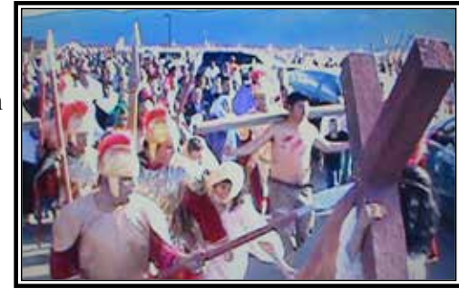
Parroquianos de Mattawa recrearon el camino hacia al Calvario.