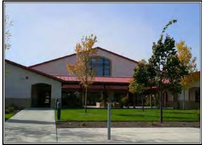
La parroquia Our Lady of Fatima tiene una presencia acogedora.

Cuando la actual iglesia en North Dale Road fue diseñada, los planes incluían la creación de un local para bienvenida, y, desde que la iglesia fue consagrada en el 2001, el diseño ha trabajado muy bien, creó el Diácono Schrom. El edificio estilo misión-española cuenta con un patio con una fuente, suficiente espacio para reunirse alrededor de la fuente bautismal, un crucifijo grande que mide 8 X 12 pies sobre el altar, y una distribución de asientos en