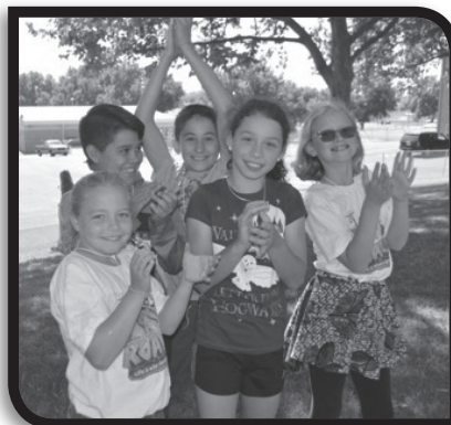
Los participantes disfrutaron de la Escuela Bíblica de Vacaciones de Cristo Rey.

“Rugir: La Vida es Salvaje ~ Dios es Bueno” fue el tema de la Escuela Bíblica de Vacación de la Iglesia Christ the King realizado del 17 al 21 de junio. El enfoque fue sobre ayudar a descubrir una “comprensión tremendamente refrescante” de cómo Dios es bueno – tocar vidas, cambiar corazones y acercarnos más a Él. En total, se contó con la participación de unos 26 preescolares; 200 del kínder al 5to grado; más de 60 voluntarios líderes de secundaria; más de 60 voluntarios de escuela intermedias; y 40 voluntarios adultos adicionales. Se recaudó un total de $535.50 para ayudar a los necesitados de agua limpia, a través de Servicios Católicos de Ayuda. Alimentos no perecederos fueron donados al banco de comida de Richland.