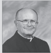
Honor Especial Padre Perron Auve