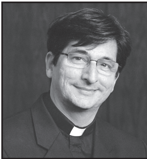
Obispo Joseph Tyson

¿Por qué es esto tan importante? Es importante porque incluso si - Dios quiere - la Corte Suprema de Estados Unidos revocara la Decisión Roe vs. Wade, la decisión regresaría a los estados. Muchos estados ahora están probando los límites ahora en