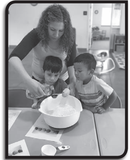
Un voluntario bilingüe de PREPARE que facilita un grupo semanal de Play & Learn enseñando a los niños a preparar bocablitos simples en casa.

Estas voluntarias son solamente tres de más de 100 en toda la Diócesis de Yakima que viven su fe a través de la acción. Ellas realizan obras de misericordia y