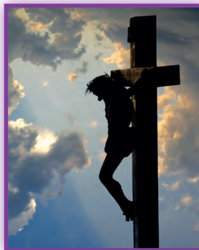
Jesús dio su vida por nosotros.