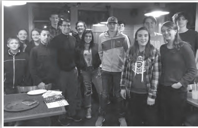
Los estudiantes representando a Favor de la Vida se reunieron en una sesión organizativa en diciembre en Yakima.

Los Estudiantes pro Vida tienen cinco “pilares” claves de actividades: crear conciencia de la crisis de aborto y reclutar estudiantes para ayudar a confrontarla; exponer sistemáticamente la industria del aborto; cabildear para la aprobación de una legislación