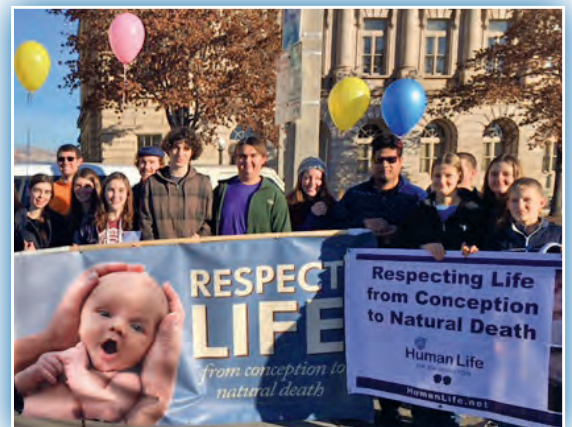
Los estudiantes representando a Favor de la Vida se reunieron en Millennium Plaza después de la Caminata Por La Vida en Yakima.

Si los jóvenes no se unen pronto en los esfuerzos pro-vida, "lo que va a suceder es que no sólo podremos matar a cualquier niño... sino que también podemos considerar