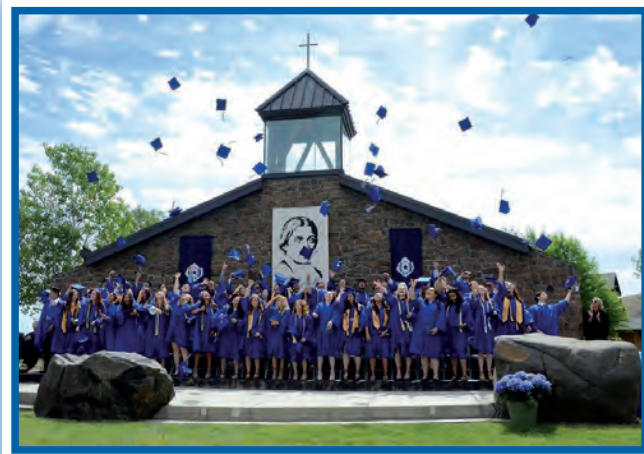
Graduación de La Salle, 2017.

Estos viajes de inmersión van desde viajar a Seattle para trabajar en los albergues para los desamparados y los comedores; a un viaje a Blackfeet Reservation en Browning, Montana, para educar a los niños y aprender sobre la Cultura Nativo-americana; a viajes a Rochester, New