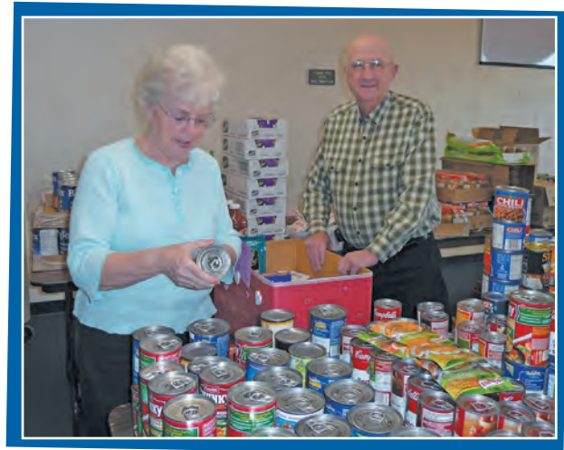
Cada año, voluntarios ayudan a clasificar y embalar los artículos para las cajas.

Sólo pensemos que el dinero que gastamos en una caja de chocolates puede realmente iluminar el día de los menos afortunados (¡y es mucho más saludable para ustedes!)