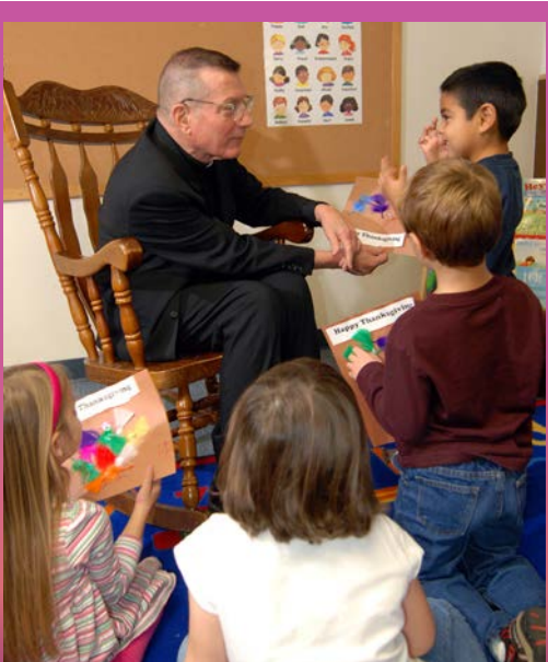
El Obispo Sevilla visitó el centro infantil de Carroll Children's Center en Yakima.

¡Por favor, mantenga al Obispo Emérito Sevilla en sus oraciones a medida que comienza este nuevo capítulo de su vida! Le damos las gracias por sus muchos años de servicio a nuestra Diócesis.