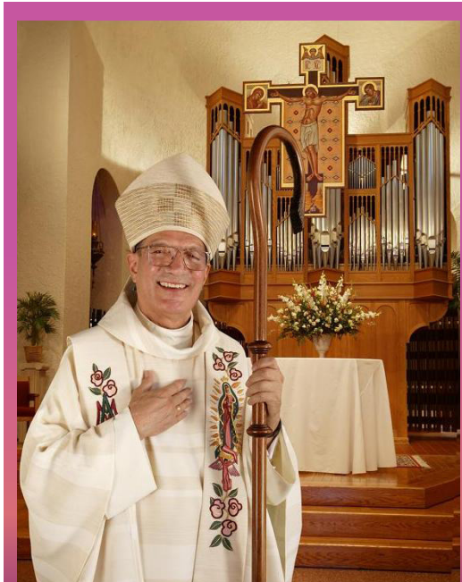
Obispo Emérito Sevilla ha servido como un fiel pastor de su pueblo.

“He estado pensando en ir a casa durante unos cinco años”, dijo el Obispo Sevilla, que llegó a Yakima desde San Francisco, donde se crió y fue ordenado obispo auxiliar en 1989. Uno de sus asociados Jesuitas le sugirió regresar a California, mientras que él todavía está en buen estado de salud, y es lo que decidió hacer.