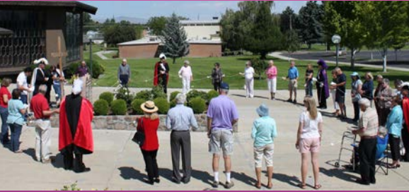
Un Rosario viviente fue patrocinado por los Caballeros de Colón, este evento se celebró en la parroquia Holy Family en Yakima el 29 de mayo. Los participantes formaron un círculo y sosteneron cuentas grandes del rosario, tomándose turnos al decir cada una de las oraciones.