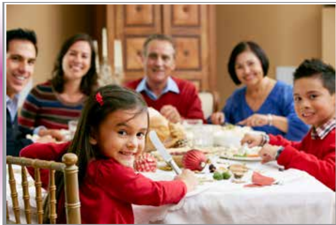
Cada día ofrece oportunidades de decirle a la gente lo importante que son.

Y siempre, siempre mostrar tu amor por todos aquellos a tu alrededor. ¡Como la vida sigue, estos recuerdos tendrán mucho más valor – y durarán mucho más tiempo – que la caja de chocolates en forma de corazón llena de calorías! (Por supuesto, los chocolates pueden ir siempre junto con el amor y el aprecio...)