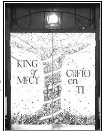
La Puerta Santa de St. Paul Cathedral proclama "Rey de la Misericordia" y "Confío en Ti."

Verifique con su párroco local, o visite el sitio web diocesano, www.yakimadiocese.net , y busque 'Parish Pilgrimages' para que se informe cuando su parroquia está invita a visitar la Catedral de St. Paul.