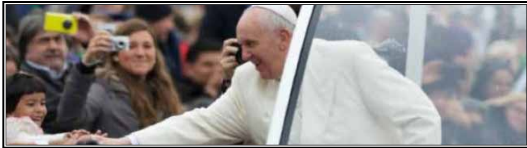
Francisco visitará Filadelfia después del Congreso Encuentro Matrimonial de la Familias. http://www.worldmeeting2015.org/

“El Papa Francisco nos dice: ‘Toda persona es un regalo para el Pueblo de Dios en su jornada,’” señala en Obispo Joseph Tyson. “Yo reconozco que estas son sólo dos de numerosas causas dignas que necesitan asistencia; yo simplemente pido que ustedes den lo que puedan ... en apoyo a esta colecta y en alabanza a Dios por los dones que la vida consagrada ofrece a nuestra Iglesia.”