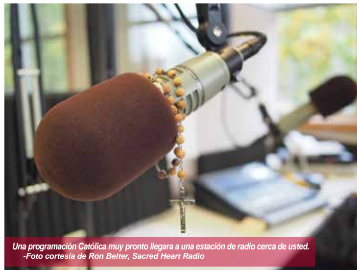
Una programación Católica muy pronto llegará a una estación de radio cerca de usted.

Y, en Washington Central, las innovaciones continúan llegando. Para ayudar a llegar a un público más amplio en el área de Moses Lake,