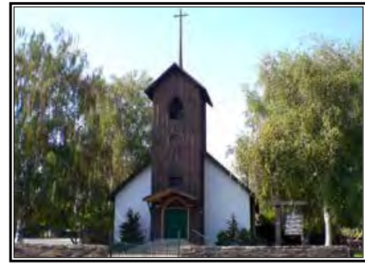
La Parroquia de St. Mary en White Swan comenzó como una misión.