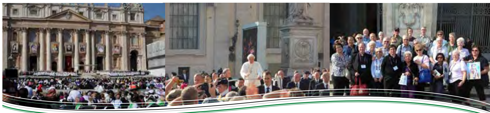
Una vista de la multitud reunida en la Plaza de San Pedro, con fotos de los siete santos nuevos visibles en primer plano.