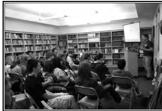
Jóvenes se reunieron para una presentación en la convención en Wenatchee.