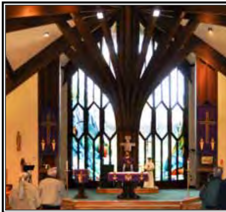
El "Árbol de la Vida" y vidrieras son puntos focales en la iglesia.

Otros feligreses señalaron que los estudiantes de música de la universidad contribuyen grandemente