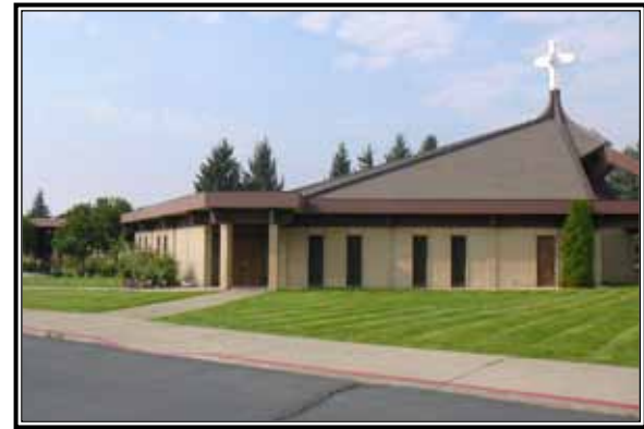
La Parroquia de St. Andrew recientemente celebró su 125º aniversario.

"Es una iglesia muy viva, todo funciona," dijo ella. "La gente aprecia los talentos de todo el mundo."