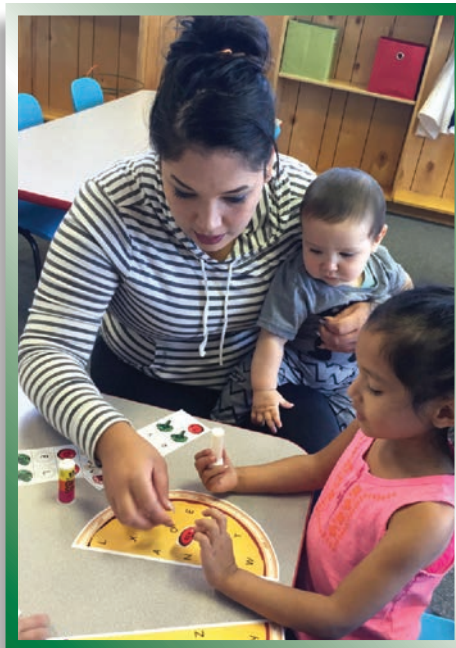
Una joven madre y sus hijos disfrutaron de una actividad en el Centro Familiar.

Con base en el Family Center en 811 West Vineyard Drive en Kennewick, la cual es una extensión de la iglesia St. Joseph, los programas sirven a mujeres embarazadas y familias y cuidadores con niños pequeños.