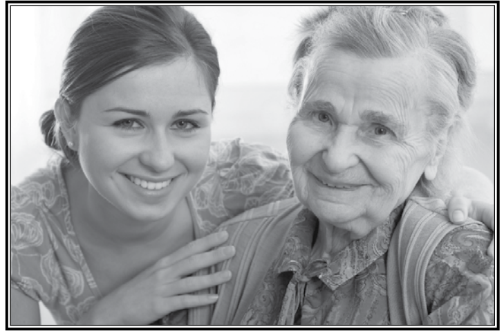
Todos podemos tomar un momento para ayudar a los demás.