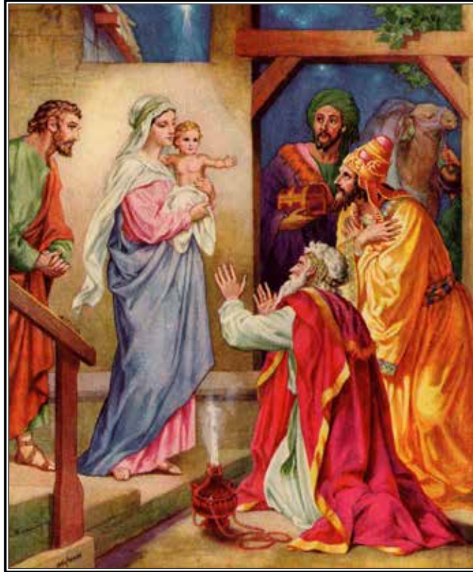
Sigamos el ejemplo de los Reyes Magos y buscar a Cristo a lo largo de todo el año.

Por ejemplo: considere asistir a la Misa diaria incluso una vez por semana o una vez al mes, además de asistir los fines de semana y los Días de Fiesta de Guardar. Y, ¿recuerda algo llamado Confesión? Tal como lo dice un anuncio de Nike “Hágalo” – de forma regular. Rece las oraciones poderosas del Rosario, solo o, aún mejor, con sus seres queridos. Acostúmbrese a dar Gracias antes de las comidas. Vaya a la Iglesia para las devociones de los Primeros Viernes. A través de la tienda de regalos de su parroquia, en línea a través de EWTN, o por medio de una de las numerosas compañías de catálogos, encuentre un calendario o un libro que ofrezca reflexiones diarias sobre las Escrituras o las vidas de los